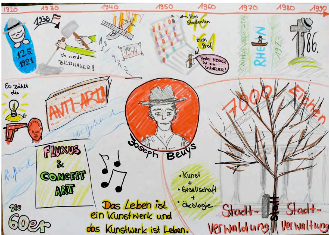
Grit Zakschewski: Joseph Beuys