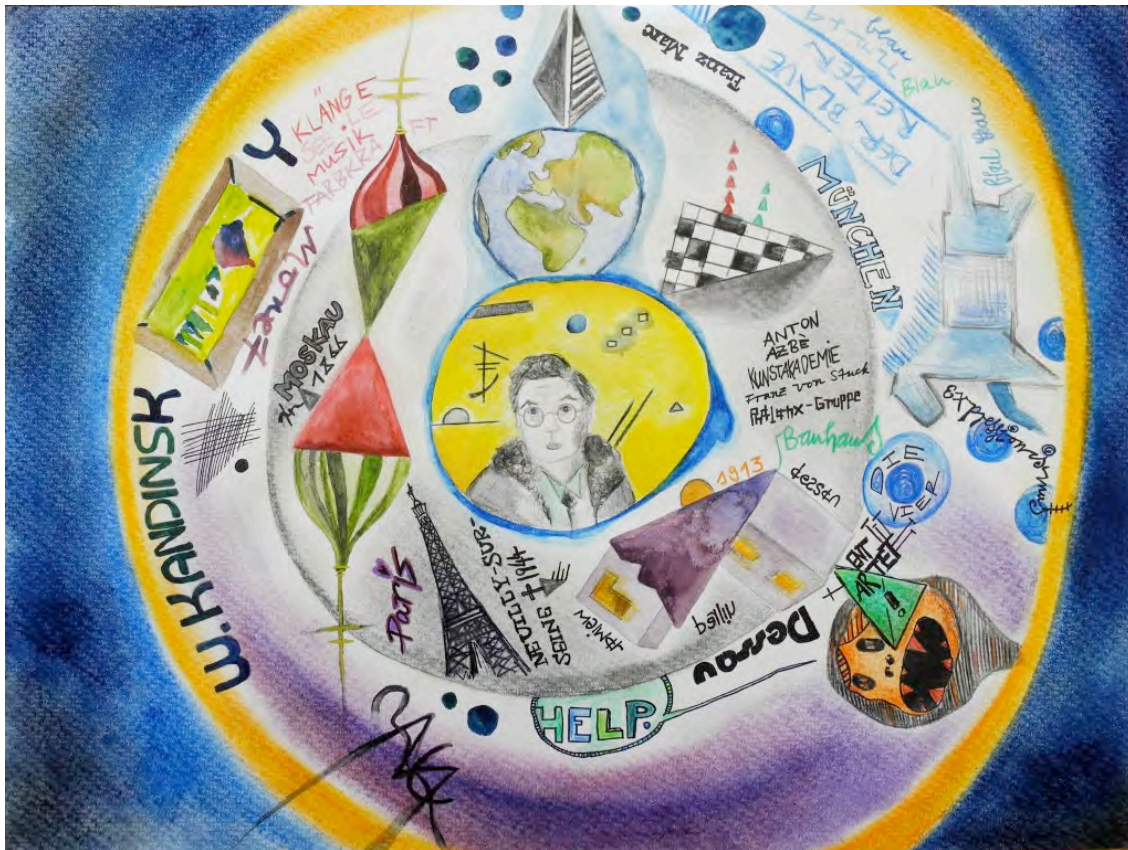
Romy Burkel: Wassily Kandinsky